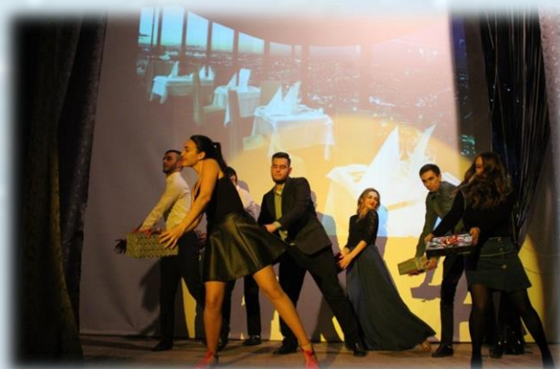
Когда пришёл на день рождения и ещё не в курсе, что тебя ожидает