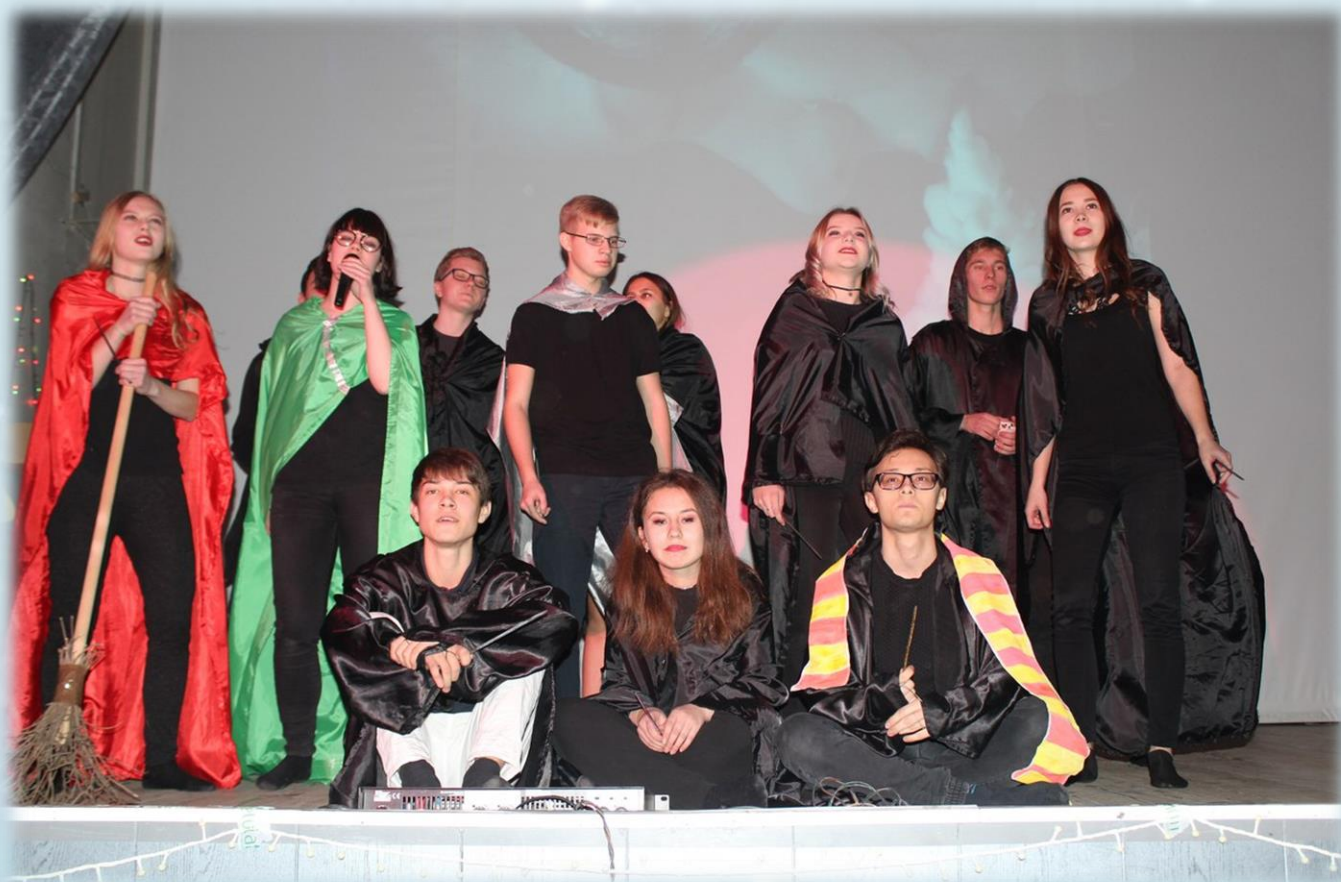
Когда всё-таки приняли в Хогвартс