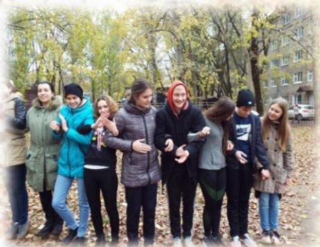
А теперь все вместе!

«болотом», тестами на доверие в команде и многим другим.