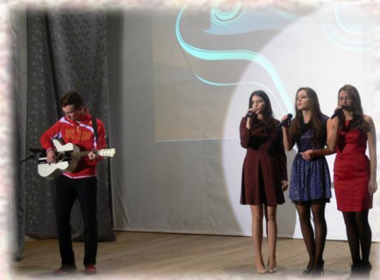
Три девицы под окном...