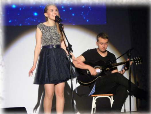
Песня под гитару