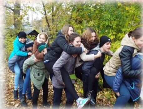
Я рюкзак, я рюкзак