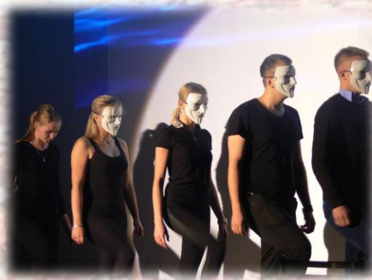
Привет от Анонимуса