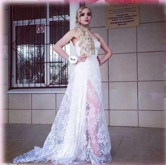
Когда доказала всем, что ты самая обаятельная и привлекательная