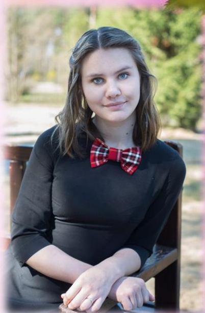
Когда зрители тебя любят