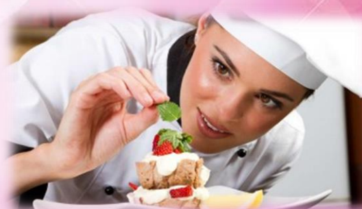
Без еды – никуда!