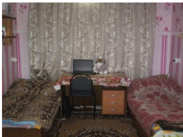
Комната первокурсников №414

Идёт третий месяц учебного года. Первокурсники привыкли друг к другу, к преподавателям, системе занятий. Всё остальное - как обычно... А для всех ли?... В этом году более 50 первокурсников заселились в общежитие. Смена обстановки, чужие люди в одной с вами комнате, два туалета на этаже, общая кухня... Всё новое и непривычное. Как ты живёшь, первокурсник, в новых для тебя условиях? Всё ли тебя устраивает, спокойно ли ты спишь, комфортно ли тебе? 28 октября студсовет общежития провёл анкетирование среди первокурсников, и с его результатами мы хотим вас, Читатель, ознакомить.