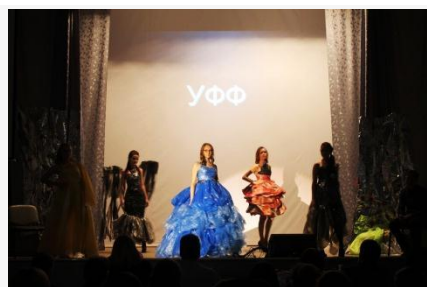
УФФ. Театр моды

21 и 22 октября 2015 г. в нашем учебном заведении проходил традиционный конкурс – фестиваль «Алло, мы ищем таланты!». Первокурсники «сражались» за звание «самого талантливого» факультета. В первый конкурсный день свои творческие возможности показали учетно – финансовый факультет и факультет коммерции. Во второй день - факультет менеджмента и отделение техникума.