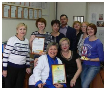
Преподаватели кафедры Технологии и организации питания и услуг

В 2015 г. Российская Академия Естествознания (РАЕ), совместно с Международной ассоциацией ученых, преподавателей и специалистов подвела итоги Всероссийского конкурса «Золотая кафедра РОССИИ».