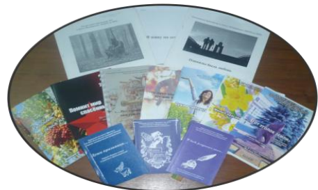
Наши творческие работы с 2004 по 2014 г.