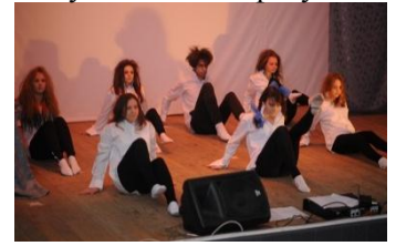
На сцене факультет коммерции

I-е место занял факультет коммерции; II-е - факультет менеджмента; III-е - учётно-финансовый факультет; IV-е - техникум.