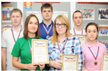
Вот они, победители!

30.10.14 Проходило Первенство по дартс среди учебных заведений Ассоциации «Торговое образование», посвященное 50-летию нашего учебного заведения. В соревнованиях принимали участие 63 студента из Пермского торгово-технологического колледжа, Пермского государственного профессионально-педагогического колледжа и Пермского института (филиала) РЭУ.