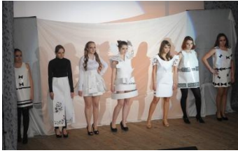
«Театр моды» факультета менеджмента

21 и 22.10 В институте прошёл традиционный конкурс для первокурсников «Алло, мы ищем таланты!» В конкурсе приняли участие студенты всех факультетов и техникума. 21 октября свои таланты показали студенты факультета коммерции и техникума, 22 – факультеты менеджмента и УФФ. Концерт каждого из участников длился 40-50 минут.