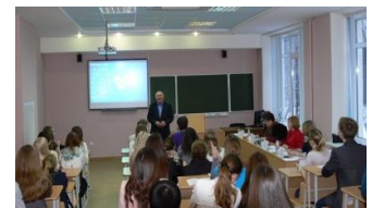
Рабочий момент конференции

7-12.11 В институте прошла VI международная научно-практическая конференция «Тенденции развития мировой торговли в XXI веке», посвящённая 50-летию учебного заведения. Для участников конференции и гостей студентами и выпускниками института был дан праздничный концерт. 21 ноября состоялась студенческая конференция с участием студентов вузов и колледжей г. Перми и Пермского края.