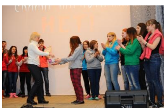
За I место награждается команда «Индиго»

20.10-19.11 В институте проходила акция «Молодёжь против наркотиков». Завершением её стал конкурс плакатов и агитбригад «Наркотикам – нет!», который в течение нескольких лет проходит в рамках ассоциации «Торговое образование». В конкурсе агитбригад особенно активно участвовали 2 учебных заведения «Ассоциации»: Краснокамский многопрофильный техникум и Пермский институт (филиал) РЭУ им. Г.В. Плеханова. Победителем стала наша агитбригада «Индиго»!