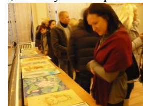
Что бы выбрать?

«Молодежь против наркотиков и СПИДа», которая пройдёт 2 декабря в Медицинском университете, и начало конкурса творческих работ «Родина моя», и выпуск новогодних стенгазет, и прочие студенческие заботы. Расслабиться не получится! Успехов вам! Удачи!