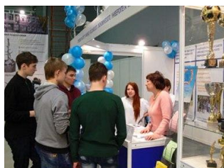
Выпускники школ у стенда института