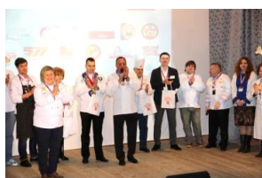
На сцене жюри фестиваля