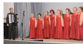
Поёт хор «Дети Войны»

об основных этапах Великой Отечественной войны, а хор исполнил песни, посвящённые этим событиям.