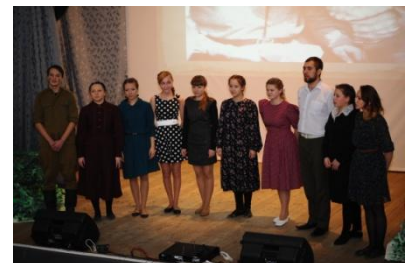
Давным-давно была война... (СПО)