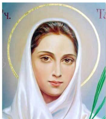
Святая Татиана, покровительница студентов

Так случилось, что именно в этот день в 1755 году императрица Елизавета Петровна подписала указ «Об учреждении Московского университета», и эта дата стала официальным студенческим праздником. А святая Татиана с тех пор считается покровительницей студентов.