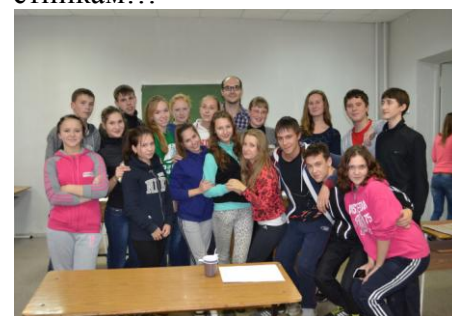
После тренинга «Дебаты»