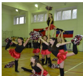
Выступление группы черлидинга

19 и 20 сентября проводился спортивный праздник «Первокурсник-2013», в котором приняли участие около 200 первокурсников. В программе праздника было 5 видов соревнований: прыжки в длину, броски баскетбольного мяча в кольцо, легкоатлетическая эстафета, кросс, перетягивание каната. На открытии праздника показала свою программу группа черлидинга.