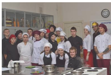
Группа – победительница I курса – ТП-21

Подведены итоги конкурсов на лучшие группы 2012-13 учебного года I курса и II-IV курсов и конкурса «Лучший студент года – 2012-13 г.».