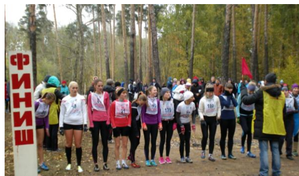
К легкоатлетическому кроссу готовы!