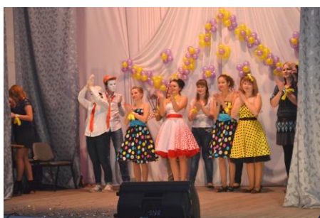
На сцене команда УФФ

Представленные программы, по сравнению с прошлым годом, были очень слабые. На наш взгляд, недостаточно поработали с первокурсниками заместители председателя студенческого совета по факультетам и тьюторы групп.