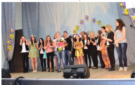
Самая многочисленная команда техникума

ра, продолжительность 1-1,5 минуты, что недопустимо.