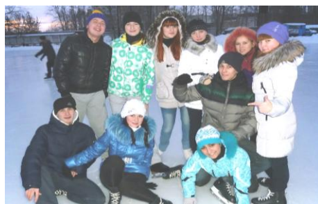
Группа – победительница 2-4 курсов – ТП-31

Лучшими группами факультетов стали: I курс – ЭК-12 (22) – УФФ, Б-11 (21) – СПО; II – IV курсы – ЭП-41 (51) – УФФ, ТП-31 (41) – факультет коммерции.