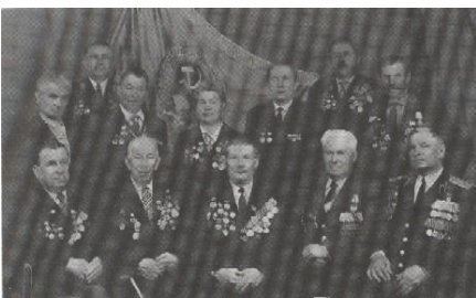
Ветераны 28-й Невельской Краснознаменной стрелковой дивизии