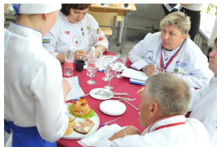
Жюри оценивает блюдо

Всего в Олимпиаде приняли участие более 100 человек, в том числе 70 участников из 14 учебных заведений из 7 городов Пермского края (Пермь, Березники, Кудымкар, Соликамск, Чернушка, Лысьва, Верещагино).