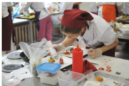
Работа «в разгаре»

5 июня 2014 года на базе Пермского института (филиала) РЭУ имени Г.В. Плеханова состоялась XI Краевая Олимпиада «Индустрия питания» среди студентов образовательных учреждений профессионального образования Пермского края по специальности 260807 «Технология продукции общественного питания».