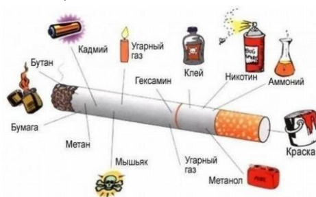
Вещества, попадающие в организм при курении

в табачном дыме, будучи ядовитым газом, приводит к уменьшению содержания кислорода в крови. Никотин действует на слизистые оболочки пищевода, желудка и кишечника, вызывая их воспаление. В первую очередь от курения страдает нервная система человека. Гипоксия – кислородное голодание – является главным “пусковым механизмом” последствий табакокурения. Учёные установили, что никотин появляется в тканях мозга уже через 7 секунд после затяжки.