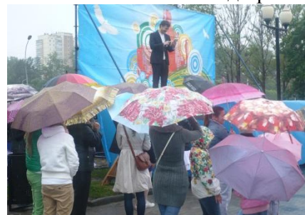
Зрителям дождь не страшен

Дождь лил, участники концерта пели, народ, хоть и немного его было, стоял, слушал и аплодировал... Концерт состоялся! Потому что мы любим тебя, наш город, и никакой дождь не может помешать нам объясняться в любви к тебе!